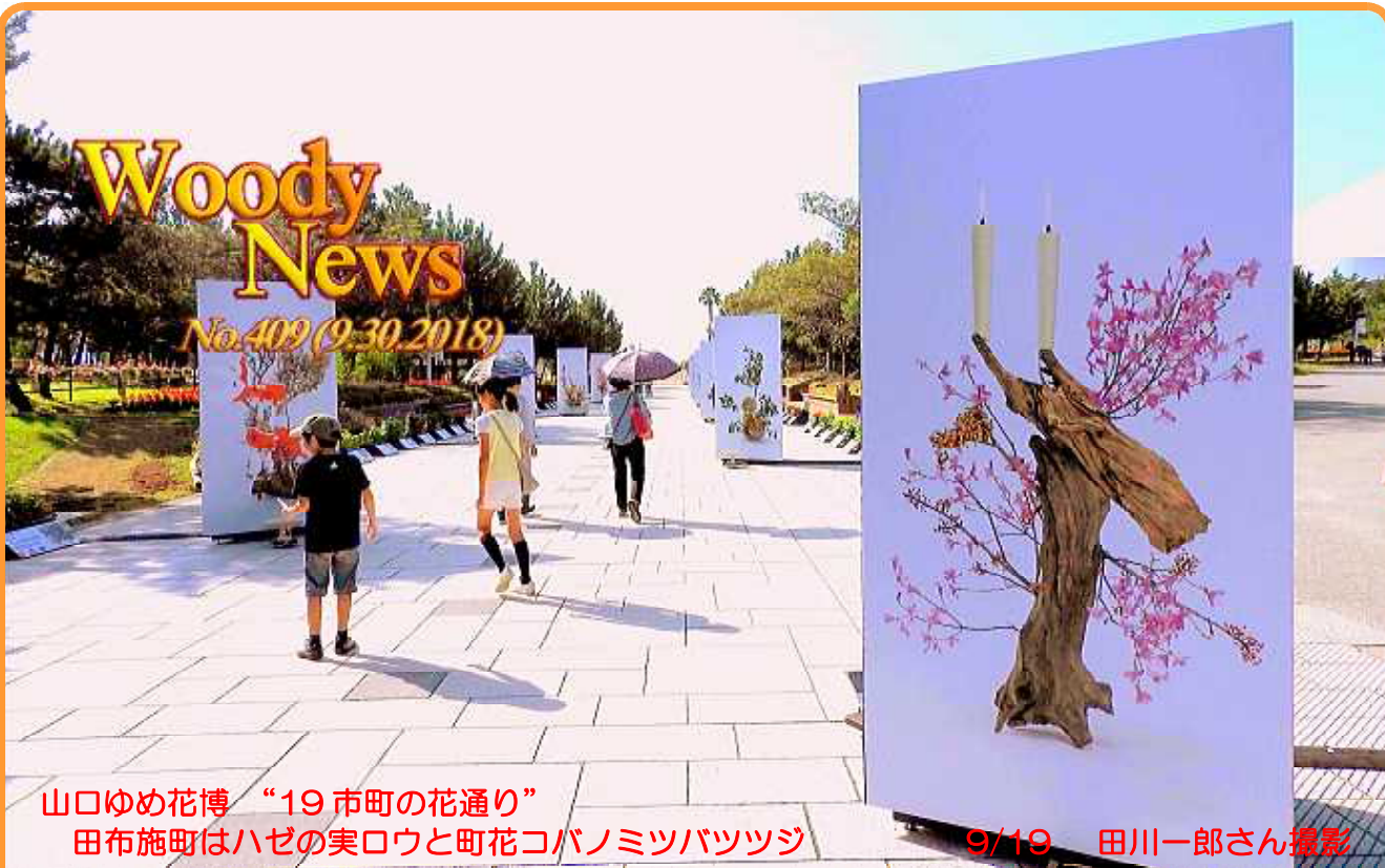
山口ゆめ花博 “19市町の花通り” 田布施町はハゼの実ロウと町花コバノミツバツツジ